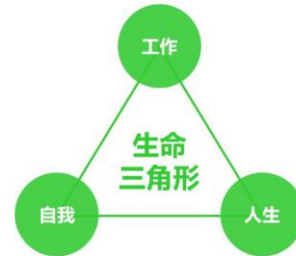
職業生涯動態系統