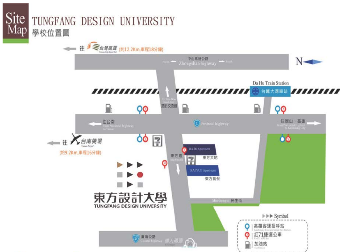
附表十 東方設計大學學校位置圖