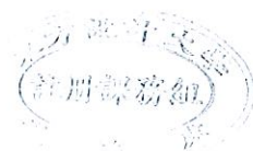
109(2)學生學期評量方式調查表【單位： 遊動與動畫設計系/科 】