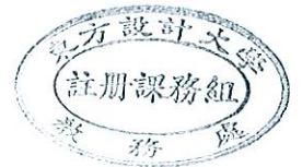
109(2)學生學期評量方式調查表【單位:設計行銷系/科】