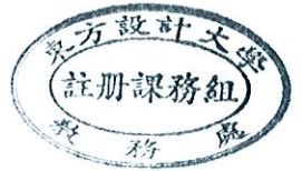
109(2)學生學期評量方式調查表【單位： 影藝 系/科】