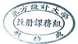
109(2)學生學期評量方式調查表【單位： 影視藝術 系/科】