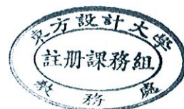
109(2)學生學期評量方式調查表【單位： 影視藝術 系/科】