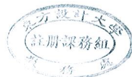
109(2)學生學期評量方式調查表【單位： 影視藝術 系/科】