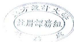
109(2)學生學期評量方式調查表【單位： 室內設計系/科 】