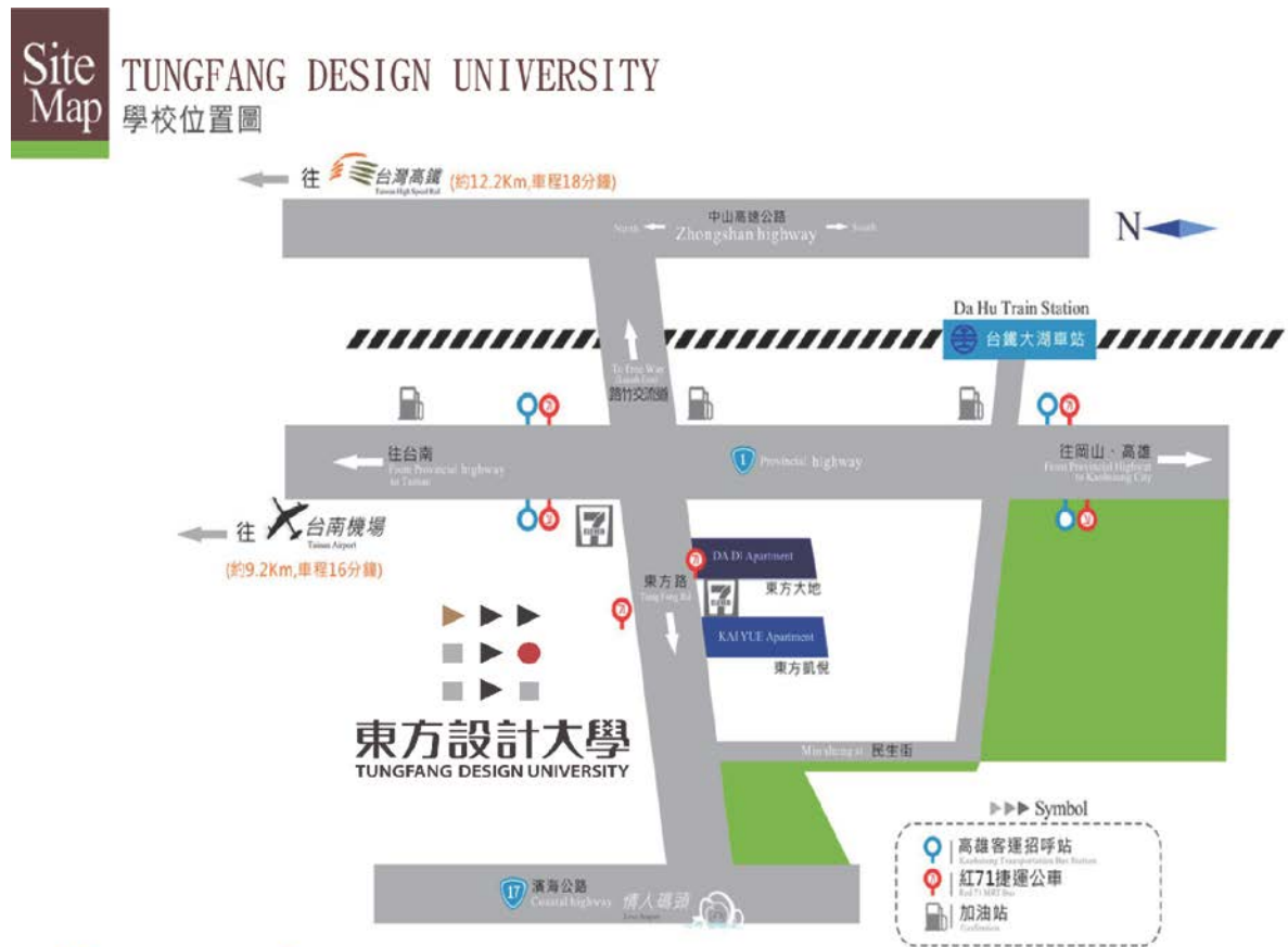
附表十 東方設計大學學校位置圖